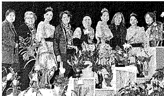
As soberanas da 3ª Festa das Orquídeas divulgando o evento em Gramado