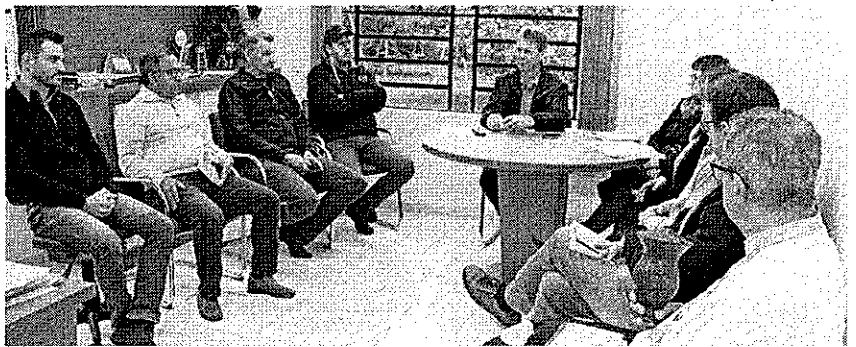
Grupo responsável pela organização terá reunião hoje, às 10h, na Prefeitura

Desde agosto, a nova corte divulga o evento pelo estado tendo participado de eventos em Santa Cruz do Sul, Vera Cruz, Santa Rosa, Lajeado, Gramado e Santa Clara do Sul. No sábado, 28, o compromisso é na cidade de Guafiba.